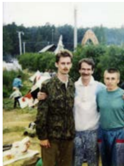
На Бажовском фестивале, 1995 год

запомнились споры об идеальном социальном строе, о роли творчества в становлении личности