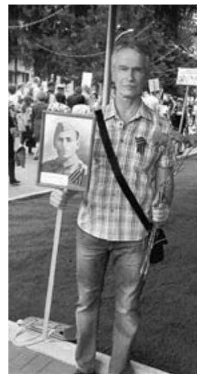
Серёжа и его дед

Я грешный, непутёвый сын Земли Ищу тебя глазами в поднебесье, Хочу, чтоб Ты увидел: вот он, здесь я. Прошу Тебя: внемли, Господь, внемли.